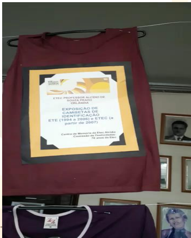
Foto 1 – cartaz de apresentação da exposição de camisetas de identificação, inserido em uma das camisetas, tendo ao fundo a galeria dos ex-diretores, no pátio da Etec Professor Alcídio de Souza Prado, em 13/05/2019, em Orlândia.