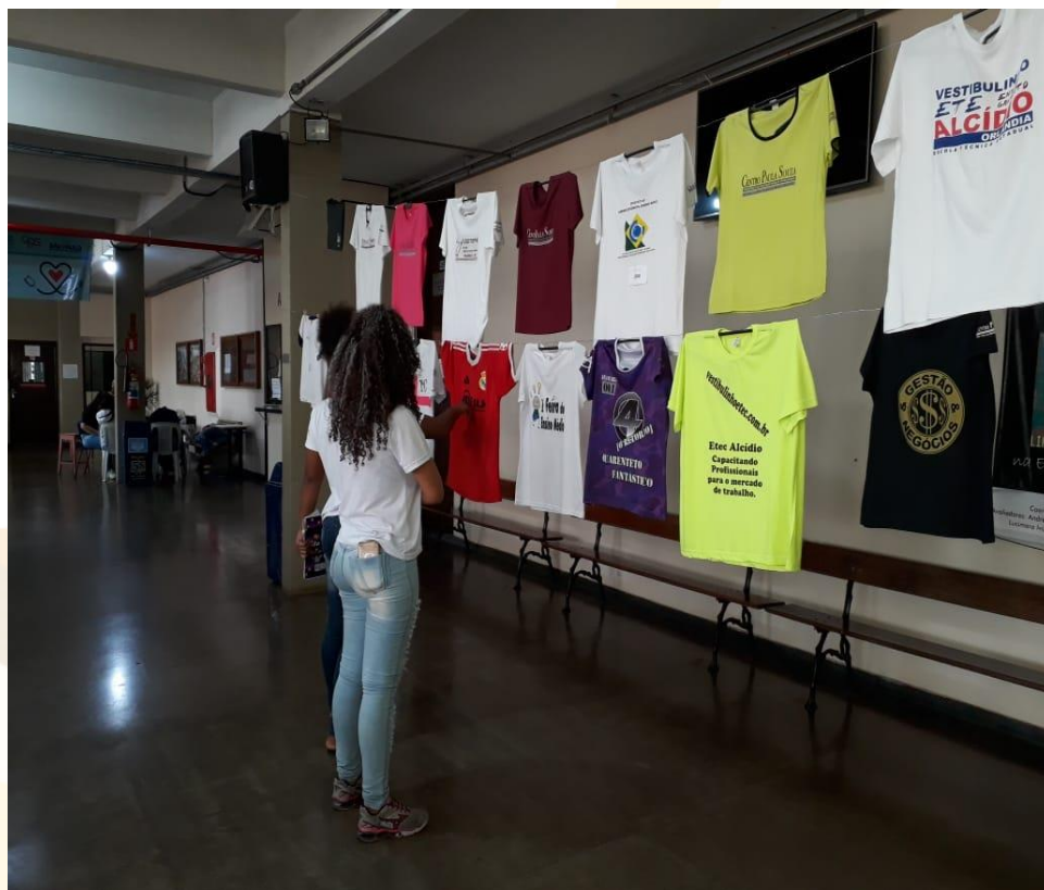
Foto 6 - Varais da exposição de camisetas de identificação, no pátio da Etec Professor Alcídio de Souza Prado, em Orllândia, no dia 14/05/2019, sendo apreciados por aluna dos cursos técnicos