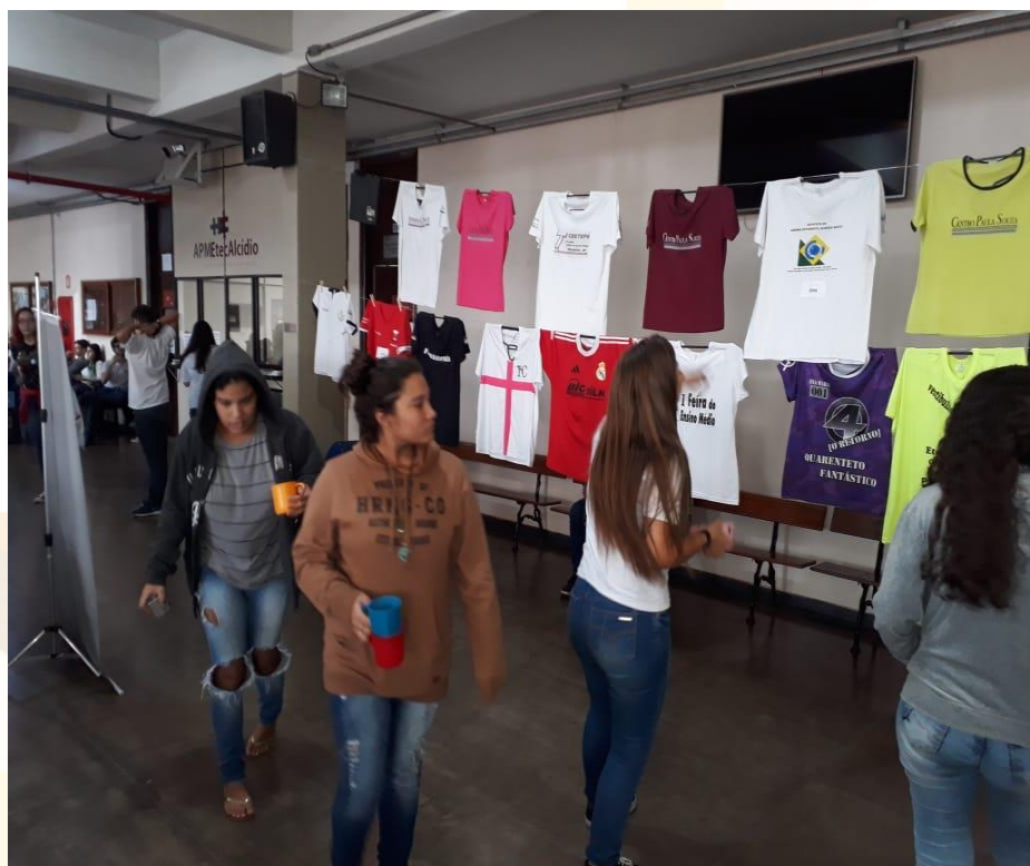
Foto 5 - Varais da exposição de camisetas de identificação, no pátio da Etec Professor Alcídio de Souza Prado, em Orllândia, no dia 14/05/2019, sendo apreciados por alunos dos cursos técnicos