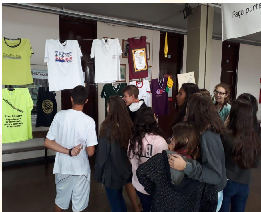
Foto 4 - Varais da exposição de camisetas de identificação, no pátio da Etec Professor Alcídio de Souza Prado, em Orllândia, no dia 13/05/2019, sendo apreciados por alunos dos cursos técnicos, tendo ao fundo, na parede, galeria de ex-diretores da Etec.