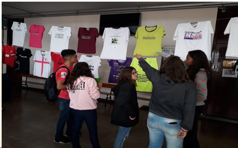
Foto 2 – Varais da exposição de camisetas de identificação, no pátio da Etec Professor Alcídio de Souza Prado, em Orllândia, no dia 13/05/2019, sendo apreciados por alunos do Ensino Médio.