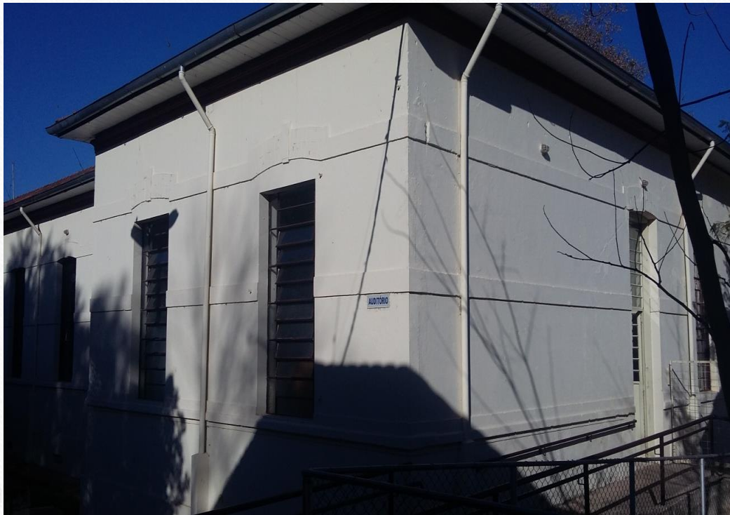
Porta de entrada a direita