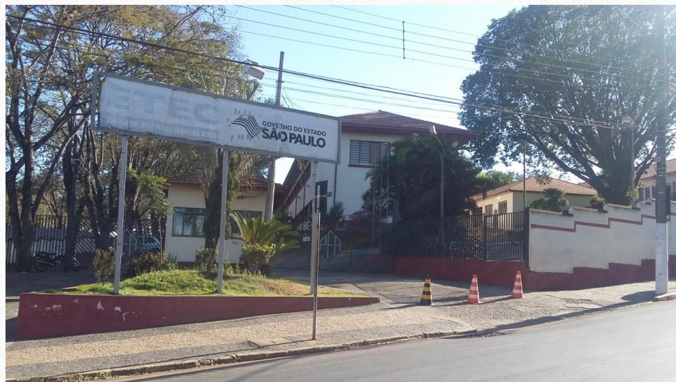
Portaria A: Entrada e Saída de alunos