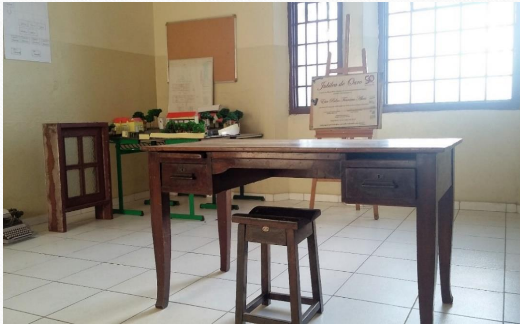
Artefatos diversos- Ano 2015