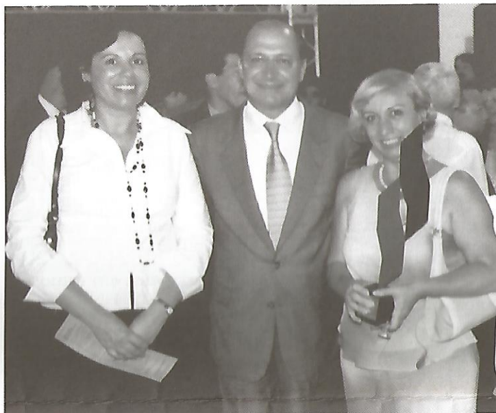
Premiação aconteceu no Palácio dos Bandeirantes, sede do governo estadual

Destaque entre os 265 concorrentes ao Prêmio, o Centro Paula Souza foi o vencedor entre, os cinco finalistas, dos 37 competidores, da categoria Ges-