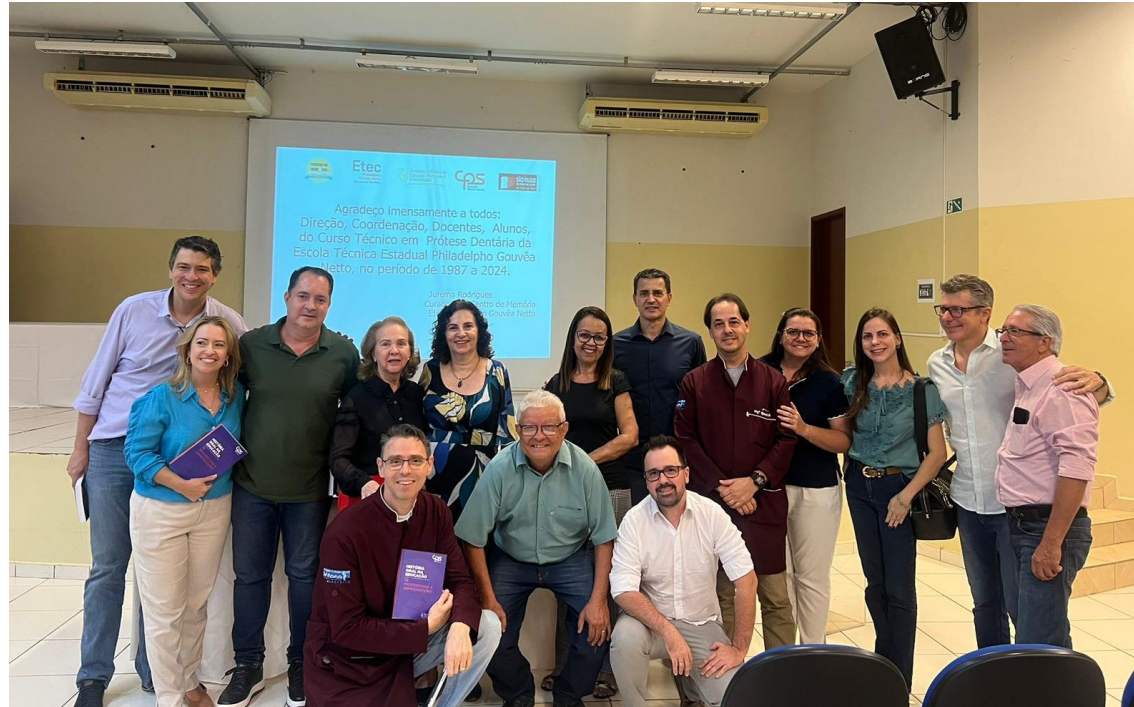
Foto Geral da Curadora do Centro de Memória e os Homenageados: Direção, Coordenadores, Professores e Alunos do Curso Técnico em Prótese Dentária (1987 a 2024)