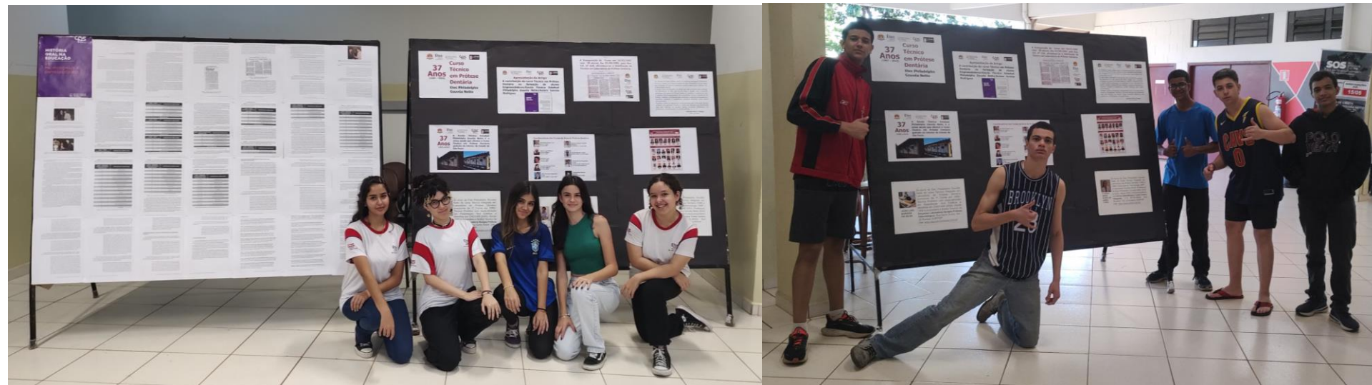
Alunos colaboradores na montagem da Exposição de Painéis