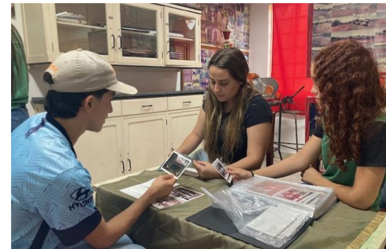
Figuras 12, 13 e 14: Alunos da 2ª série do curso em Habilitação Profissional de Técnico em Agropecuária Integrado ao Ensino Médio.