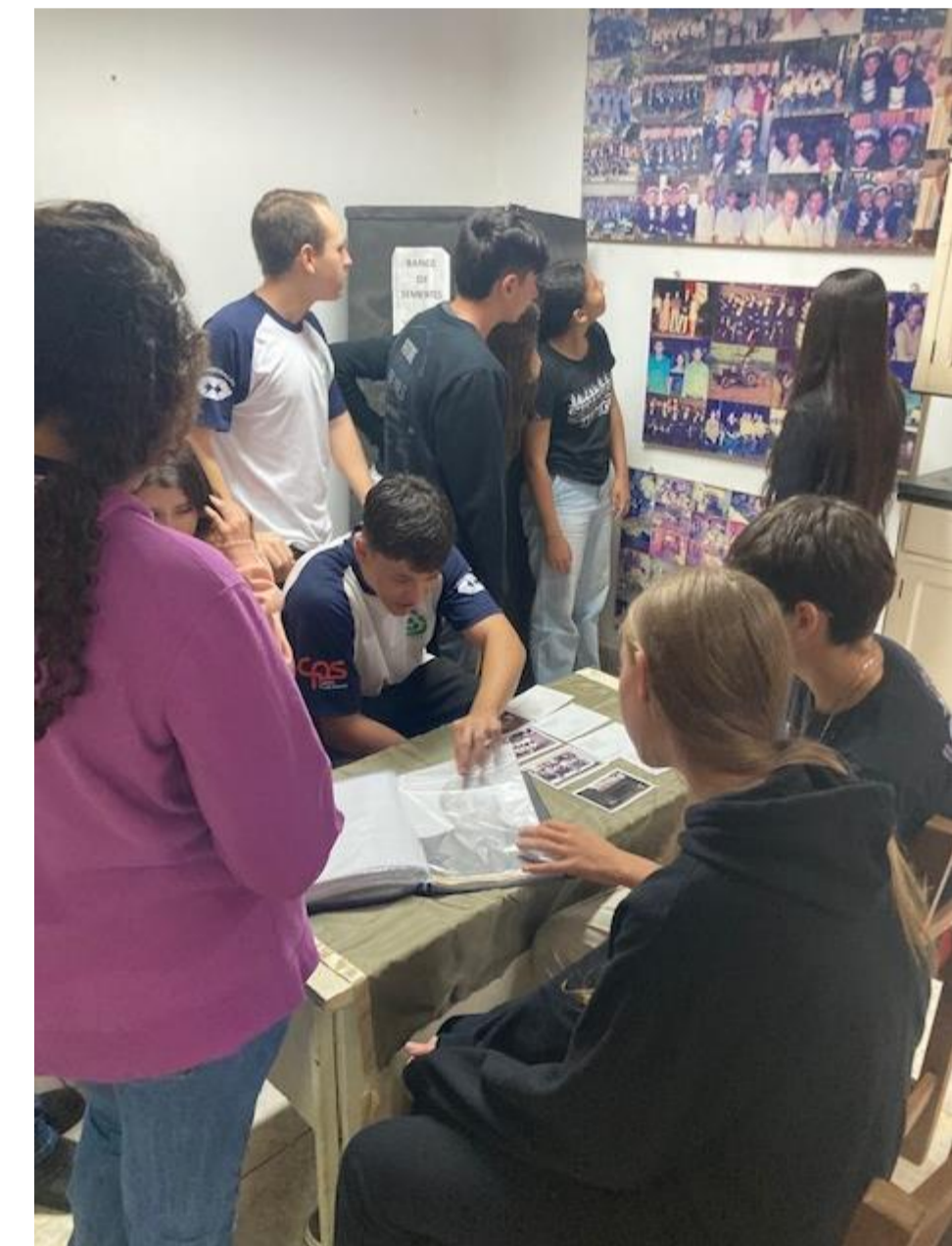
Figuras 06, 07 e 08: Alunos da 1ª série do curso em Ensino Médio com Habilitação Profissional de Técnico em Administração .