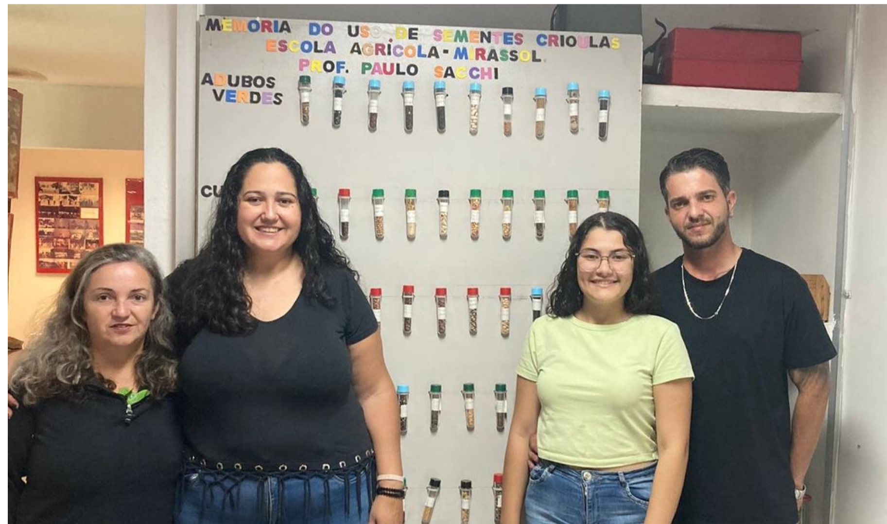
Figura 04: Alunos do 2º Módulo do curso técnico em Zootecnia .

CENTRO DE MEMÓRIA ANTÔNIO FERDINANDO FRANCISCO POSSEBON - ETEC PROFESSOR MATHEUS LEITE DE ABREU - MIRASSOL, SP