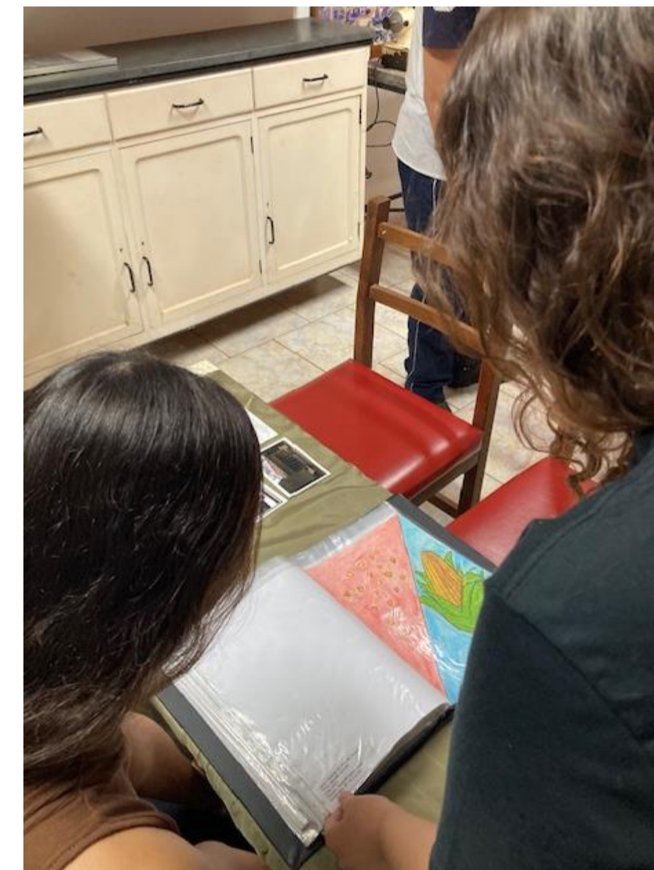
Figuras 09, 10 e 11: Alunos da 2ª série do curso em Ensino Médio com Habilitação Profissional de Técnico em Administração.