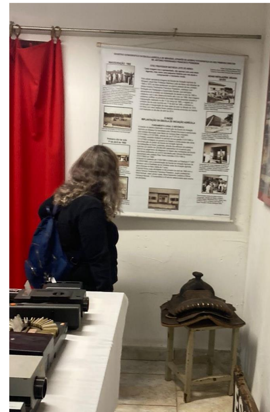
Figura 05: Aluna do 2º Módulo do curso técnico em Zootecnia .