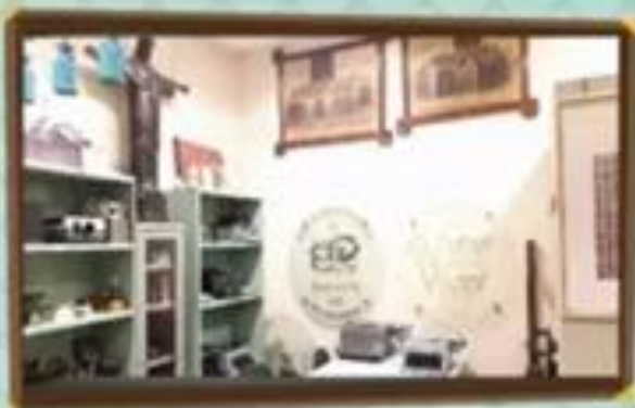
Imagem 1 : Centro de Memória Etec Fernando Prestes Autor: Daniele Torres Loureiro