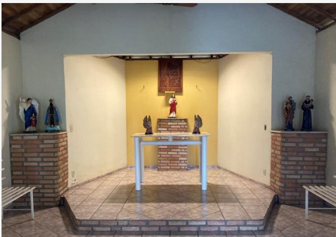
Figura 03: Vista interna da capela com as imagens do Sagrado Coração de Jesus, Nossa Senhora Aparecida e São José. (2022)