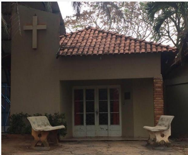
Figura 02: Fachada principal da capela. (2018)