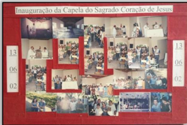
Figura 01: painel com fotos da inauguração da capela. (2015)