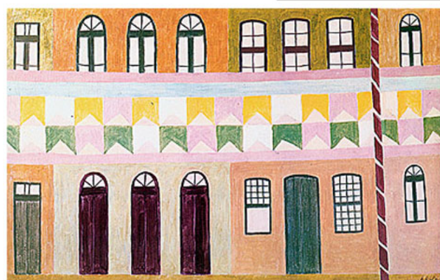
Fachada com Bandeirinhas (dec. 1950)