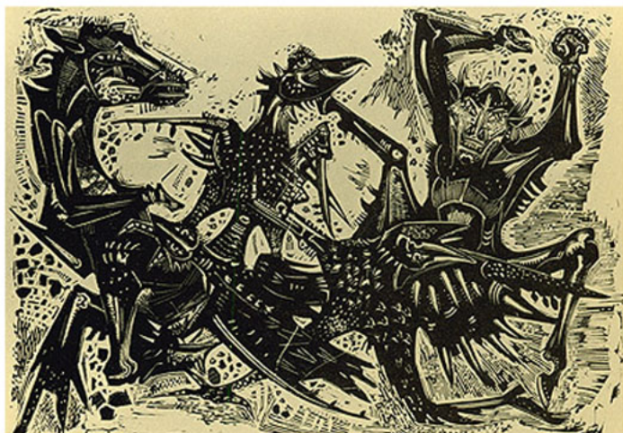
Gravura (sem título/ 1954).