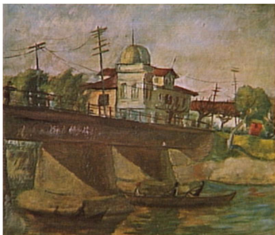
Vista da Ponte Grande (1935)