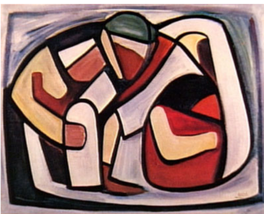
Composição com figuras (1958)