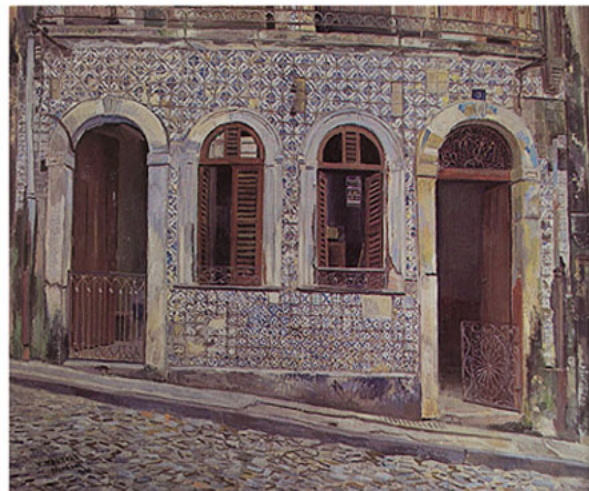
Casa de azulejos de Salvador (1966)

“Os egressos da Escola Profissional Masculina da Capital: uma homenagem aos nossos ex-alunos”