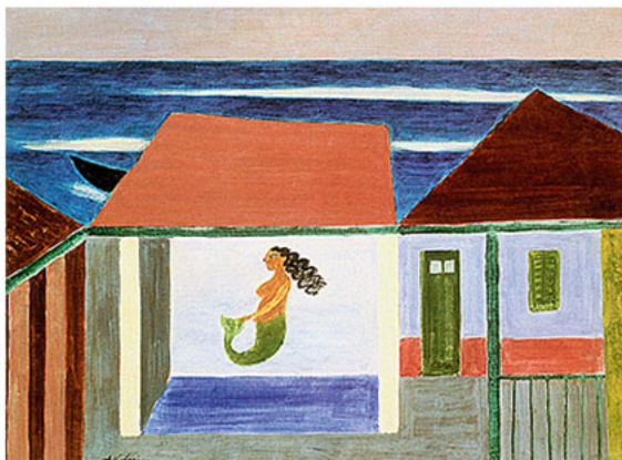
Marinha com Sereia (dec. 1940)

Alfredo Volpi (Itália, 1896 - 1988) foi um importante pintor reconhecido internacionalmente. Nasceu na Itália e muda-se com os pais para São Paulo em 1897. Estuda nas primeiras turmas da Escola Profissional Masculina da Capital, porém não conclui o curso. Trabalhou também como marceneiro, entalhador e encadernador. Torna-se pintor decorador e começa a pintar sobre madeiras e telas. Na década de 1930 passa a fazer parte do Grupo Santa Helena com vários outros artistas. Em 1940, ganha o concurso promovido pelo Instituto do Patrimônio Histórico e Artístico Nacional (IPHAN). Sua primeira exposição individual ocorre em São Paulo, na Galeria Itá, em 1944. Recebe, em 1953, o prêmio de Melhor Pintor Nacional da Bienal Internacional de São Paulo, em 1958, o Prêmio Guggenheim; em 1962 e 1966, o de melhor pintor brasileiro pela crítica de arte do Rio de Janeiro.