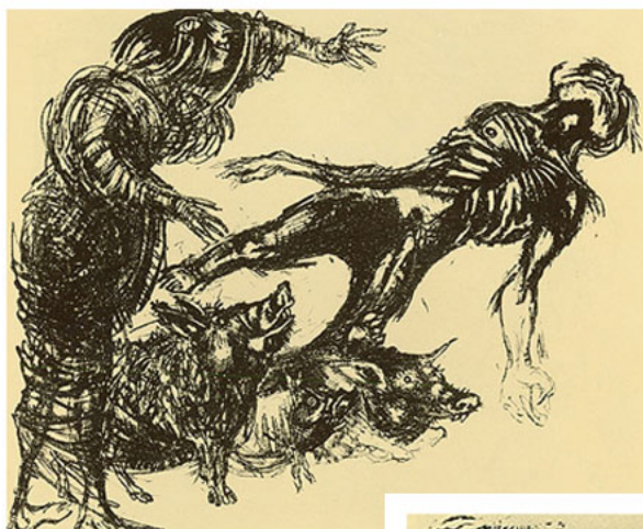
Gravura (sem título/ sem data).