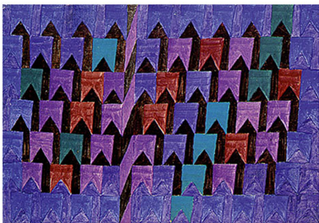
Bandeirinhas (dec. 1970)