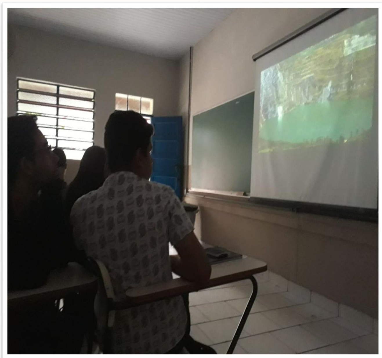
Alunos da 2ª série do Etim Administração da Etec Cônego José Bento assistindo o vídeo sobre patrimônio cultural, 15.05.2018.