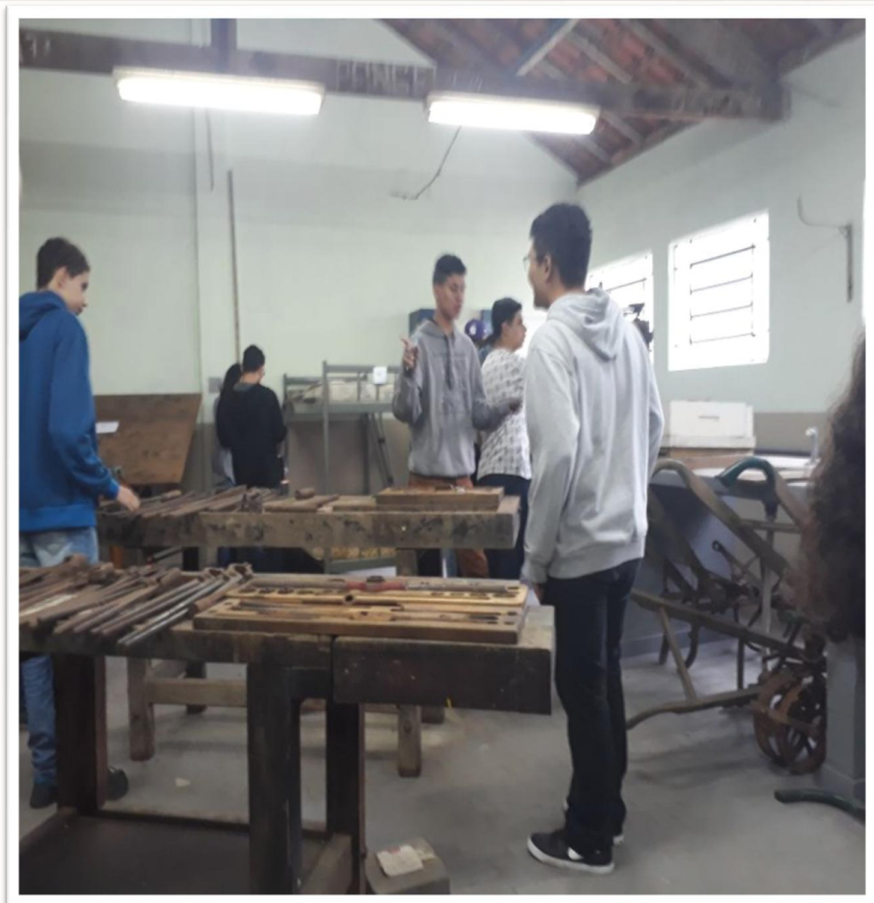
Alunos da 2ª série do Etim Administração da Etec Cônego José Bento no Espaço Memória Cônego José Bento, 15.05.2018.