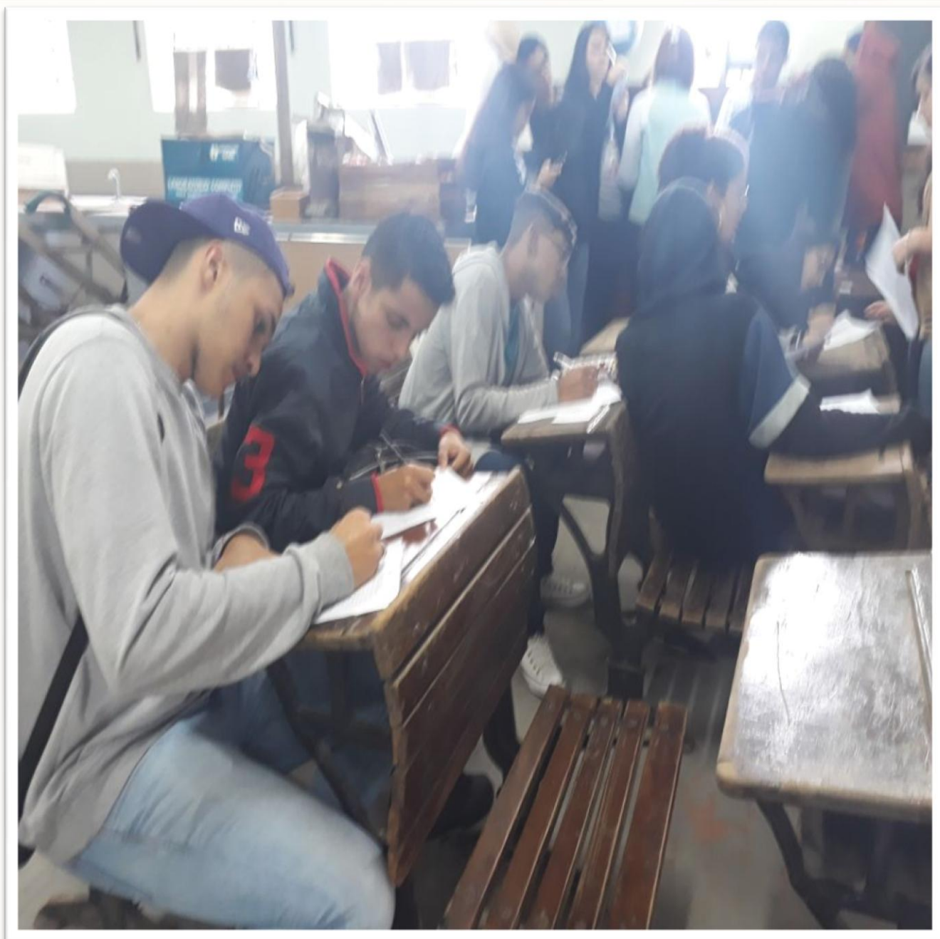
Alunos da 2ª série do Etim Administração da Etec Cônego José Bento no Espaço Memória Cônego José Bento, 15.05.2018.