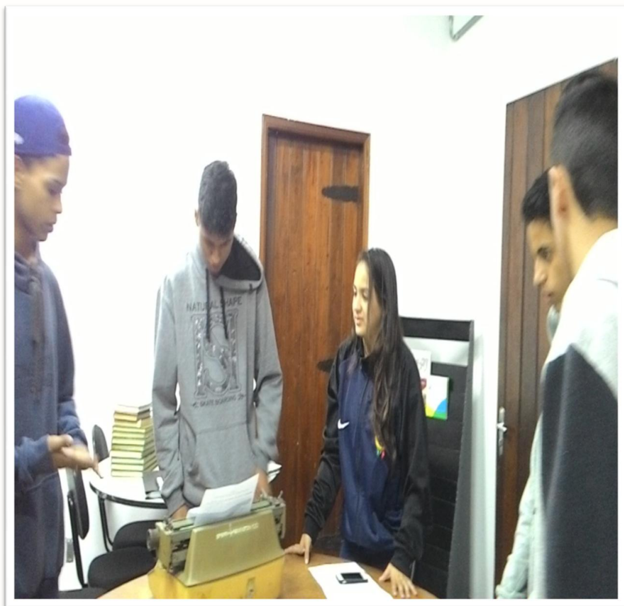
Alunos da 2ª série do Etim Administração da Etec Cônego José Bento no Centro de Memória Etec Cônego José Bento, 15.05.2018.