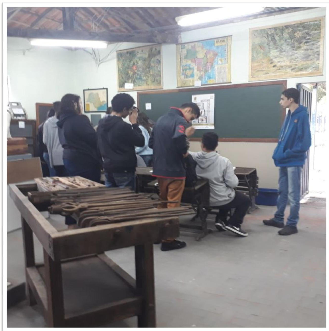
Alunos da 2ª série do Etim Administração da Etec Cônego José Bento no Espaço Memória Cônego José Bento, 15.05.2018.