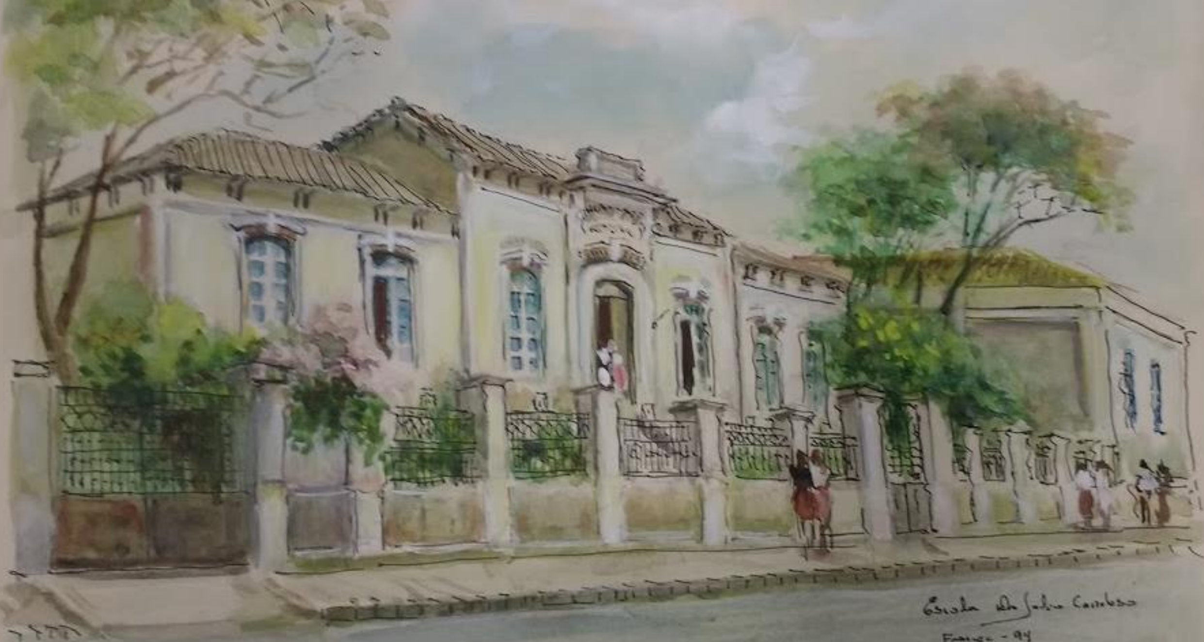
École de Jules Cambes France - 94 mars 1905