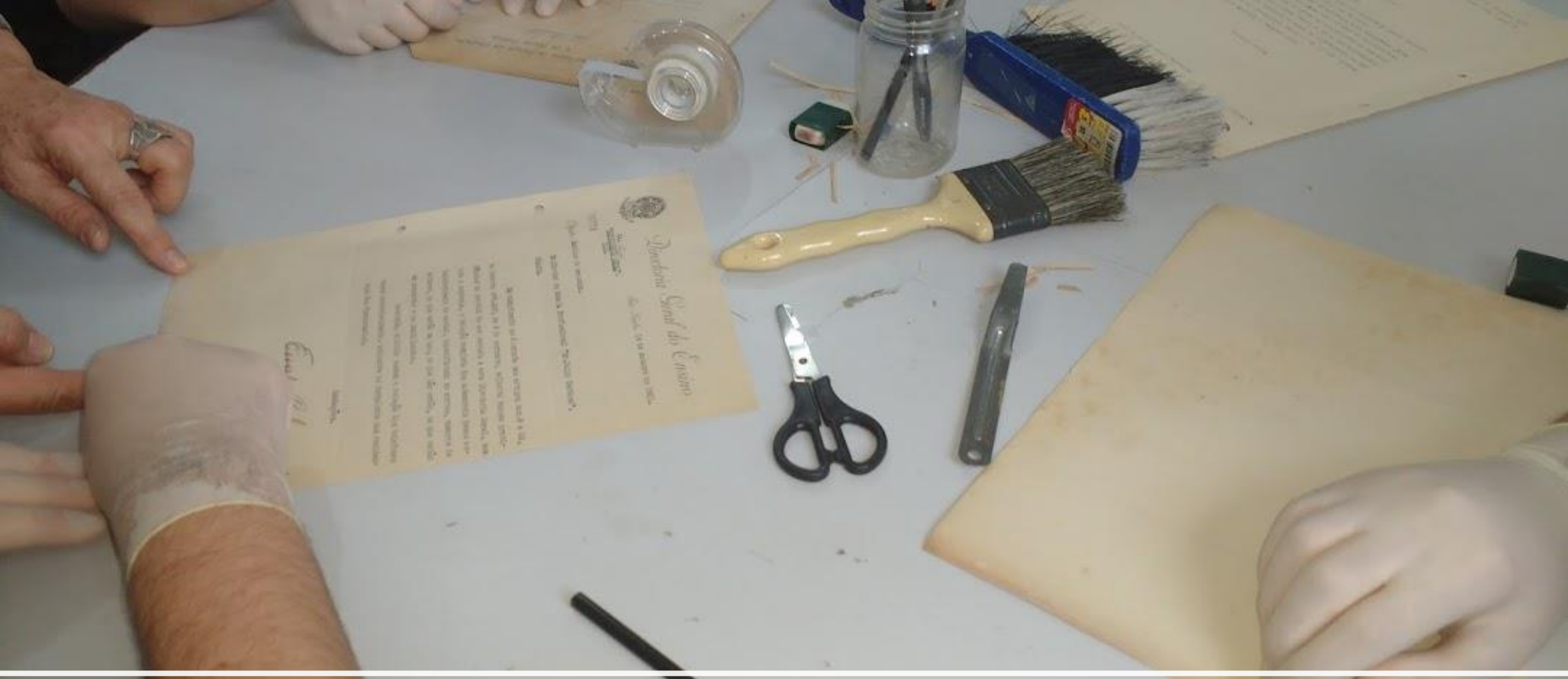
Oficinas de restauração de documentos