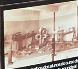
Exposição de trabalhos dos alunos do curso de mecânica, no recinto do mercado municipal - 1938