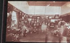
Trabalhos do curso de pintura e flores - 1939