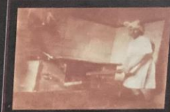
Aula prática de culinária - 1941