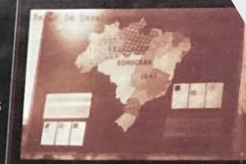
Trabalho do curso de tecelagem - 1941