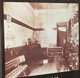
Exposição Anual - 1941