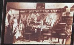
Trabalhos do curso de Economia Doméstica - 1942