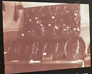
Peças confeccionadas pelos alunos do curso de plástico - 1931