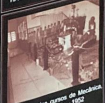
Exposição dos cursos de Mecânica, Marcenaria e Fundição - 1952