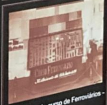
Exposição do curso de Ferrovários - 1941