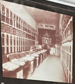
Exposição de trabalhos da seção masculina - 1939

Exposições de trabalhos realizados pelos alunos dos cursos da seção masculina