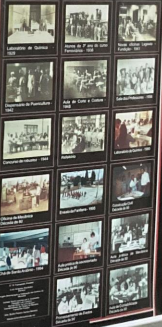
Laboratório de Química - 1939 Alunos do 2º ano do curso Ferroviário - 1938 Novos edifícios Legados - Fundação - 1961 Dispensário de Farmacologia - 1942 Ata de Curso e Cursos - 1943 Salão de Professores - 1958 Concurso de futebol - 1944 Futebol Laboratório de Química - 1959 Oficina de Mecânica - Dezembro de 60 Ensaio de Fábrega - 1950 Comunidade de Desportos de 50 Clube de Esportes - 1954 Atividade de recreação - Dezembro de 50 Ata de Curso - Dezembro de 50 Preseleção de Desportos - Dezembro de 50

A Escola Profissional Mista de Sorocaba foi o berço da educação profissional em nossa cidade. Retratos de diferentes momentos desta história.