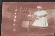
Aula prática de culinária - 1941