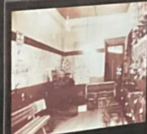
Exposição Anual - 1941