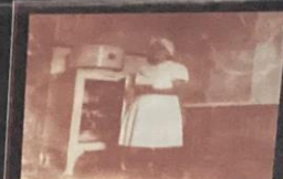
Aula prática de culinária - 1941

Economia Doméstica Curso da seção feminina na década de 40 "Instruir a mulher é preparar a escola na família"