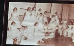
Exposição Manequins Vivos - 1955