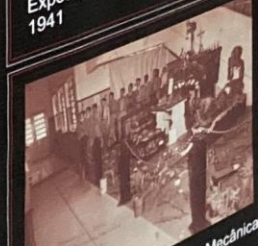
Exposição dos cursos de Mecânica, e Fundação - 1952