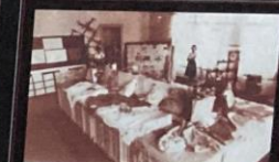
Trabalhos do curso de Economia Doméstica - 1952