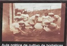
Aula prática de cultivo de hortaliças - 1941