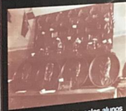
Pecas confeccionadas pelos alunos do curso de plástica - 1931