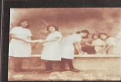
Aula prática de lavanderia - 1941