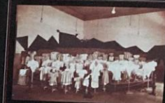
Trabalhos do curso de corte e costura - 1939