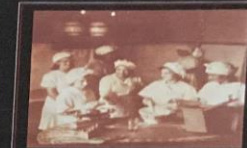
Aula prática de culinária - 1941