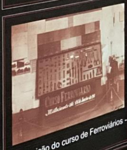
Exposição do curso de Ferrovários - 1941