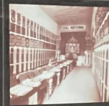
Exposição de trabalhos da seção masculina - 1939