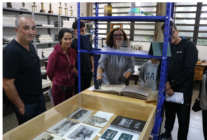
Visitantes apreciando o acervo selecionado.