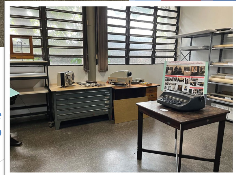
Vistas gerais do Centro de Memória da Etec Getúlio Vargas.