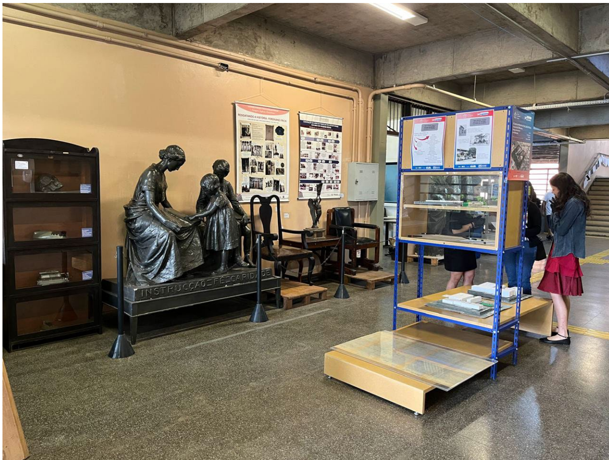
Entrada da escola pela Rua Clóvis Bueno de Azevedo. Esculturas e mobiliários do acervo. Maquetes de estudo da implantação do edifício escolar em 1964 e atual.

Espaço interno do Centro de Memória, exposição de fotografias e objetos do acervo.