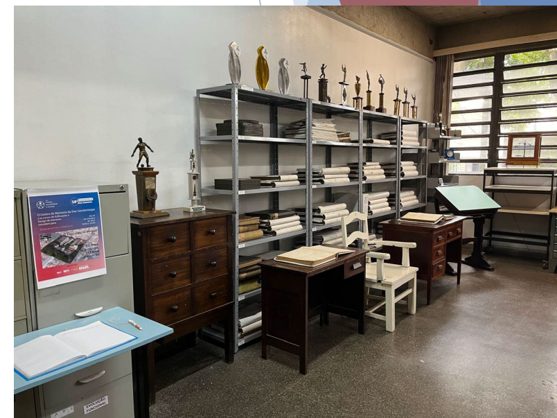
Vistas gerais do Centro de Memória da Etec Getúlio Vargas. Visitantes foram recepcionados por alunos voluntários.