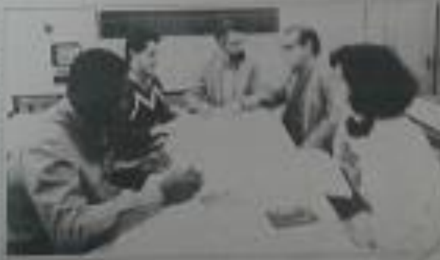
Grupos de trabalho discutindo projetos de pesquisa em uma sala de reuniões.

O sucesso do projeto dependerá do apoio contínuo das instituições de fomento e da comunidade acadêmica.