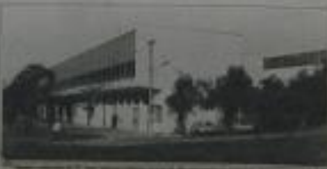
Exterior de um edifício moderno, provavelmente o campus da ETEVAV.

Desde sua fundação, a instituição tem se dedicado a proporcionar uma educação de qualidade, formando profissionais capacitados para o mercado de trabalho. A comemoração é realizada com uma série de eventos, incluindo palestras e reuniões, para celebrar a trajetória e o compromisso da ETEVAV com a educação. A ETEVAV comemora 23 anos de existência, marcando um importante marco em sua trajetória.