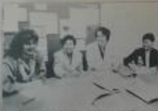
Um grupo de pessoas em uma reunião, discutindo assuntos relacionados ao trabalho.

O especialista do MEC, Dr. [Nome], visitou o Ceteps para avaliar o desempenho das instituições de ensino. Durante a visita, foram realizadas reuniões com os dirigentes e professores para discutir as dificuldades e as possibilidades de melhoria. O Dr. [Nome] destacou a importância da qualidade do ensino e a necessidade de investimentos em infraestrutura e formação de recursos humanos.